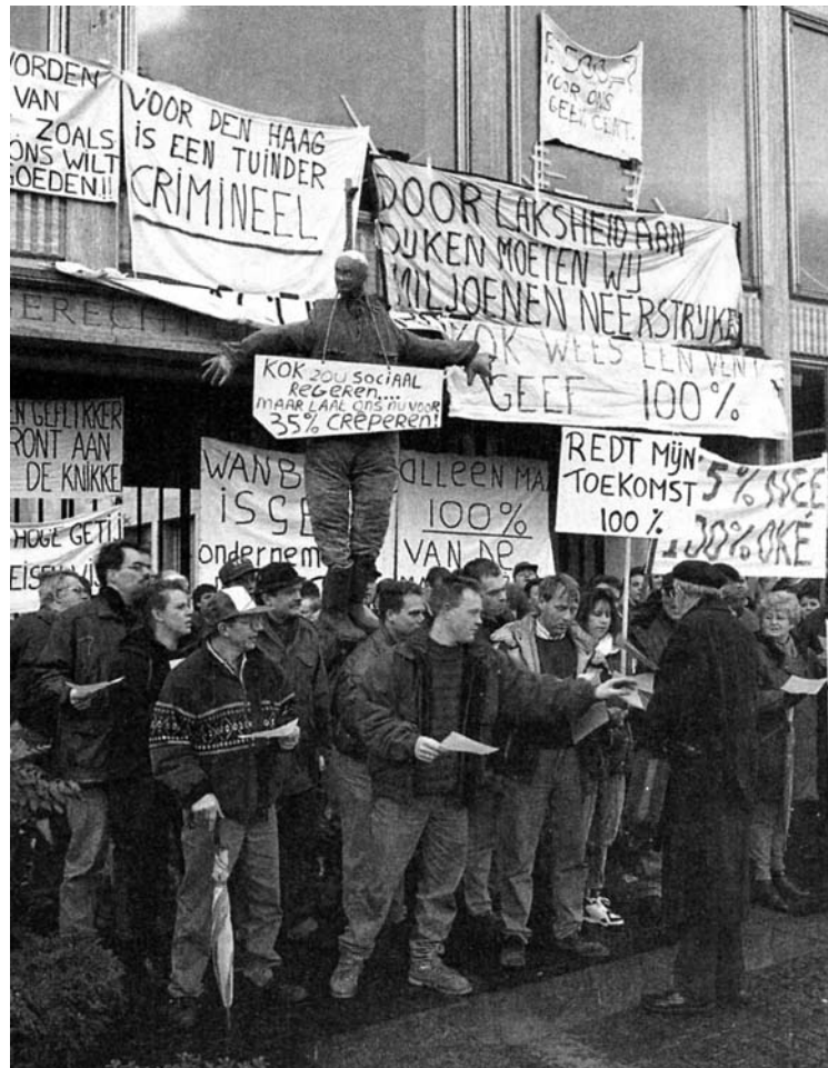
Demonstranten van het Actiecomité 100% blokkeren op 6 maart 1995 de toegang van het Gelderse provinciehuis

vergelijkbare politieke koers volgen. Van 2002 tot 2006 nam hij in de Tweede Kamer plaats voor de Lijst Pim Fortuyn (LPF). 94 Ook deze partij profileerde zich nadrukkelijk als alternatief voor het gevestigde gezag.