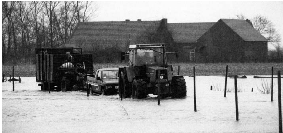
Begin 1995 moesten door de extreem hoge waterstanden van de grote rivieren veel landbouwbedrijven worden geëvacueerd.

moesten er ook kunnen worden gemolken. Tot in Friesland en Groningen werd vee ondergebracht.