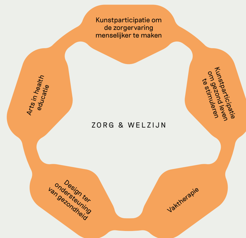
Figuur 2. Een continuüm van arts in health praktijken voor Nederland.