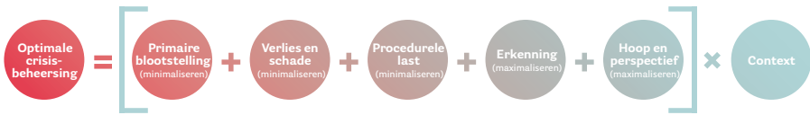
Figuur 2: Elementen van invloed op het oordeel over de crisisaanpak

Nadenkend over de rampen en crises van de laatste jaren, zijn er naar mijn idee een paar elementen te identificeren die – in combinatie – bepalend zijn voor het oordeel van gedupeerden over de georganiseerde inzet. Deze elementen zijn stuk voor stuk van invloed op de gezondheid van mensen of hangen er ten minste mee samen. Het zijn zaken die onvermijdelijk aan bod komen in de levensloop van een acute of sluimerende ramp, vaak verkeerd uitpakken en daarmee passende inhoud vormen van het proces in figuur 1. De elementen zijn onderdeel van de kernvergelijking (zie figuur 2) die ik hierna uitwerk